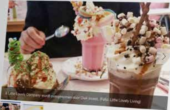
A Little Lovely Company wordt overgenomen door Diek Invest.